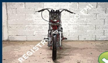
1 foto anteriore

Sfondo errato: immagine scontornata/ritoccata