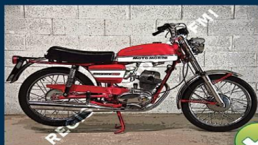
1 foto lato destro