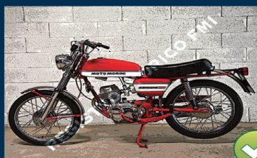
1 foto lato sinistro